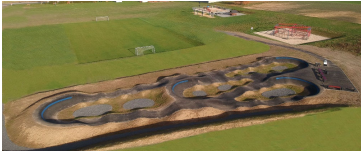
Podsumowanie 2020 roku str. 2-3