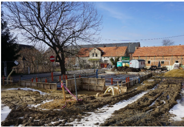
Inwestycje str. 7 - 12