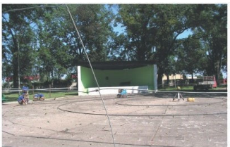
Amfiteatr w Grębobycicach