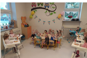
Roczek Gminnego Żłobka str. 19