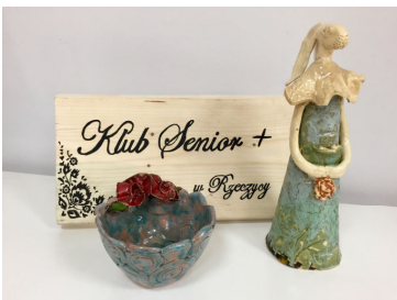
Dwa lata temu utworzono Klub Senior + str. 17