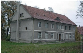
Budynek starej szkoły podstawowej odrestaurowano i zaadaptowano na potrzeby Przedszkola Publicznego w Grębobycicach