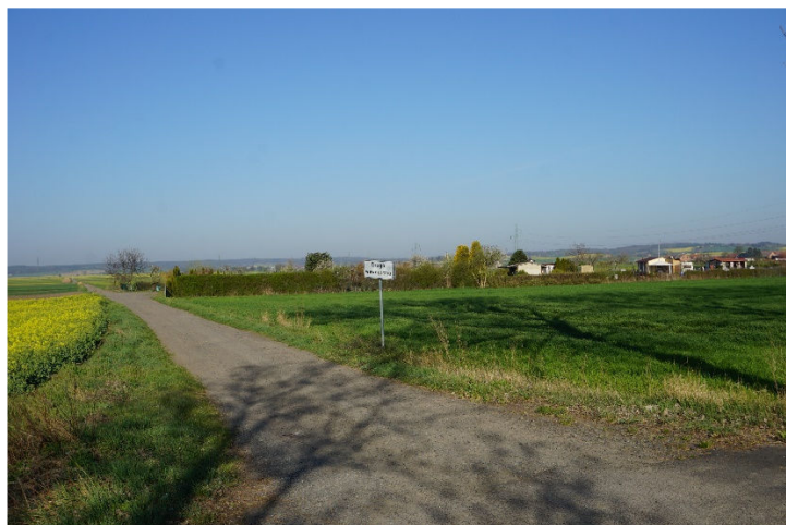
Od tej strony będzie wjazd na projektowaną obwodnicę Grębobic

Do końca sierpnia planowane jest oddanie projektu drogi łączącej Grębobice i Kwielice, która stanowić będzie obwodnicę Grębobic i połączy się z obwodnicą w Kwielicach. Droga o długości ok. 3 km będzie wykonana z nawierzchni asfaltowej. Wzdłuż drogi projektowany jest rów odwadniający oraz ścieżka rowerowa.