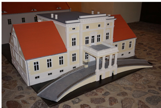
Pałac w Obiszowie

Miniatury zabytkowych pałaców z terenu Gminy Grębocice niebawem staną się kolejną lokalną atrakcją. Do Grębocic przyjechały już trzy z czterech miniatur, a w planach są kolejne oraz pomysł za zminiaturyzowanie zabytkowych kościołów. Dzięki temu będzie można zobaczyć jak w okresie swojej świetności wyglądały zabytki. Miniatury wykonane zostały w skali 1 : 25. Największym z nich jest nieistniejący już pałac w Rzeczycy. Miniatury pałaców obejrzeć będzie można podczas wystawy, którą przygotowuje Gminny Ośrodek i Biblioteka w Grębocicach.