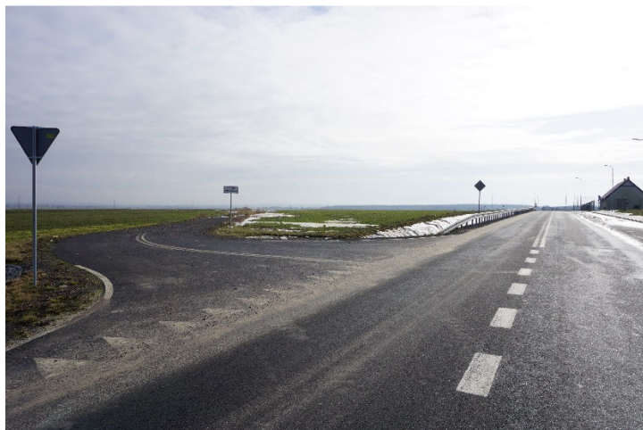
Projektowana obwodnica połączy się z już istniejącą w Kwielicach