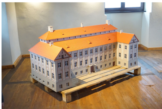
Pałac w Rzeczycy