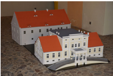
Zminiaturyzowane zabytkowe pałace str. 13