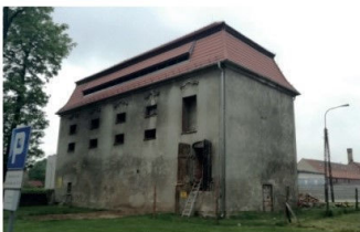
Zabytkowy spichlerz w Grębobycicach został wyremontowany i obecnie pełni funkcję Galerii Spichlerz