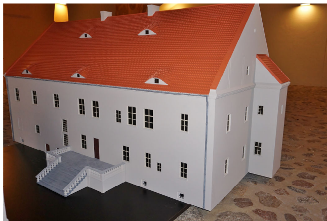
Pałac w Grębocicach