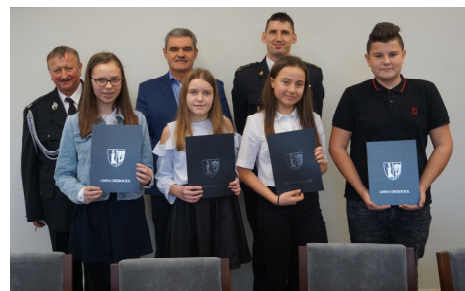
Pojadą na eliminacje powiatowe str.16