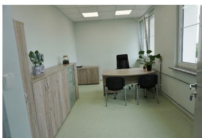
GOPS w nowej siedzibie str. 2