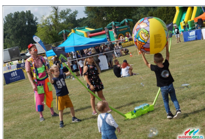
Piknik jakiego jeszcze nie było str. 17