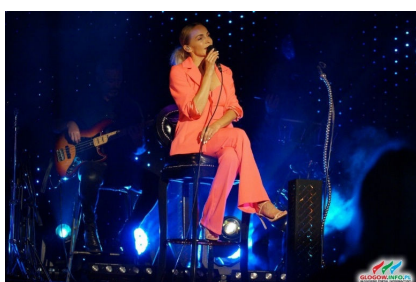
Pierwszy koncert w tym roku str. 15