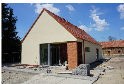
Remonty i inwestycje str. 5-9