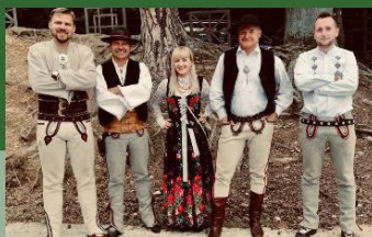
Kapela HAJDUK ze Szczyrku

Zdjęcie z ZAKOPIAŃSKIM MISIEM? zrobisz w Gręboćnicach!