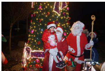
Choinka rozświetlona str. 12