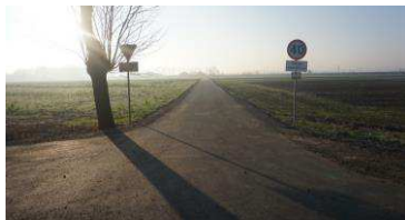
Remonty i inwestycje str. 4-7