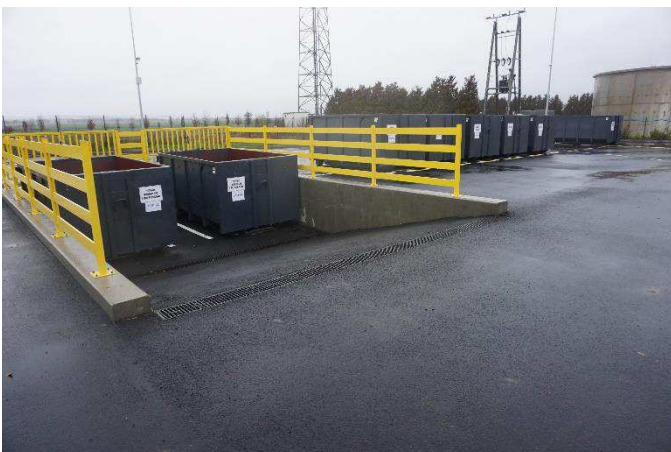
Autor: Martyna Siadul