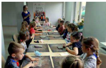
Pracownia ceramiczna w Klubie Senior + str. 18