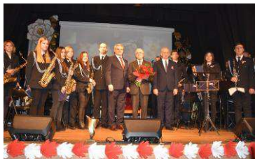
103 rocznica Odzyskania Niepodległości str. 3