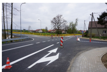
Inwestycje drogowe str. 6