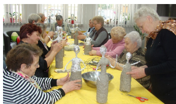
Wieści z Klubu „Senior +” str. 8