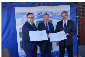
Za darmo do Polkowic str. 2