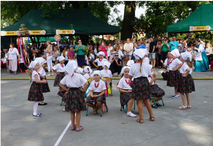
Występ dzieci został nagrodzony brawami