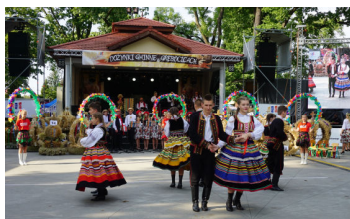
Dożynki str. 8-11