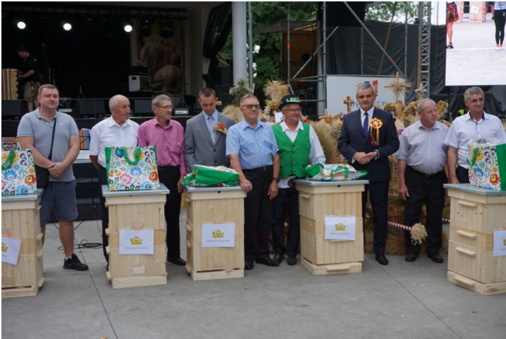
Wzorowi pszczelarze z Gminy Grębocice