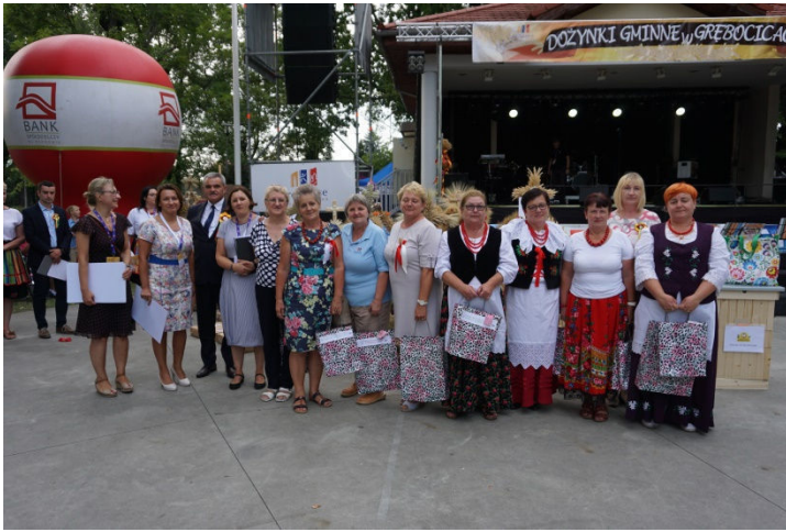
Nagrodzeni w konkursach dożynkowych