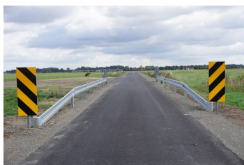
Investycje str. 5-7