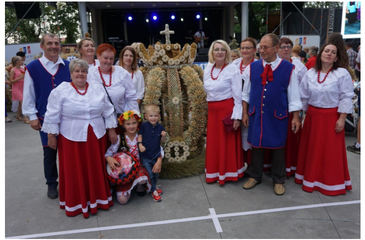
Najpiękniejszy wieniec przyjechał z Retkowa