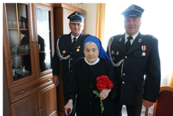
Niech nam żyją 200 lat str. 15