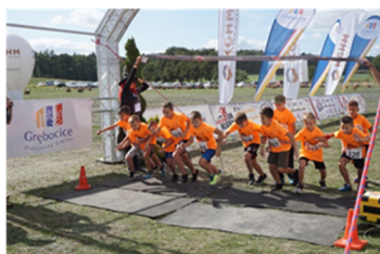
Cross Baby Jagi str. 18