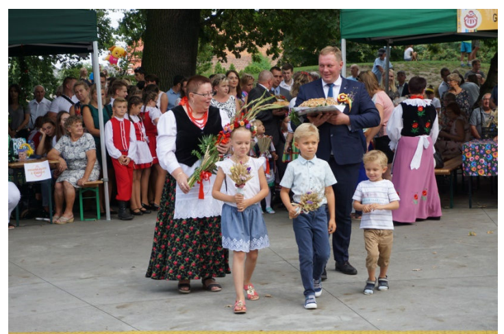
Grodziszcze to jedna z delegacji która wrocława chleb