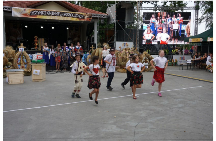
Występ delegacji wieńcowej z Szymocina