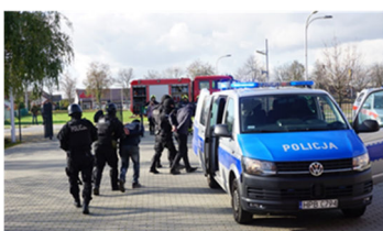
Manewry z obronności str. 15