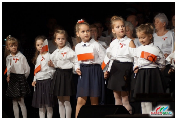
Rocznica Niepodległości str. 10