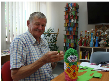
Klub SENIOR+ Str. 12