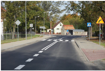
Investycje str. 6-9