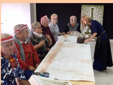
Seniorzy uczestniczą w ciekawych zajęciach Str. 13