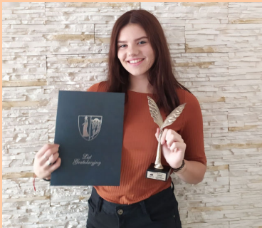
Stypendia od Wójta Str. 10