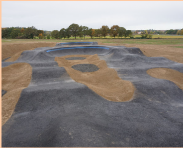
Remonty i inwestycje Str. 5-8