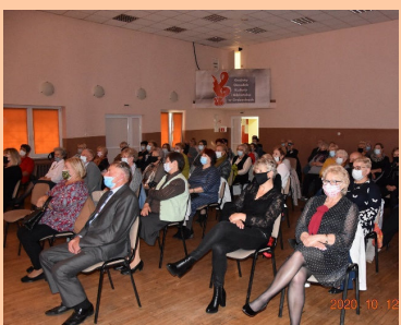
Studenci zainaugurowali kolejny rok Str. 12