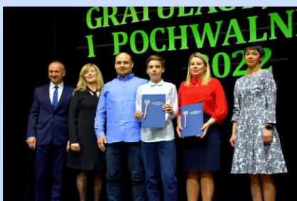
Wręczenie listów gratulacyjnych, str. 7