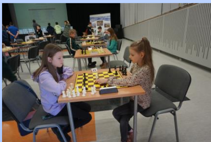
I Mistrzostwa Szachowe o Puchar Wójta Gminy Grębobocice, str. 10-11