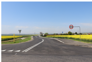
Inwestycje i remonty