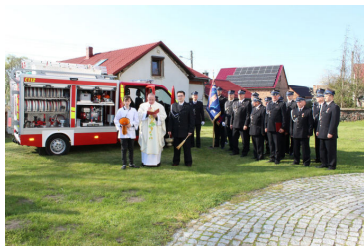
70 – lecie OSP Szymocin