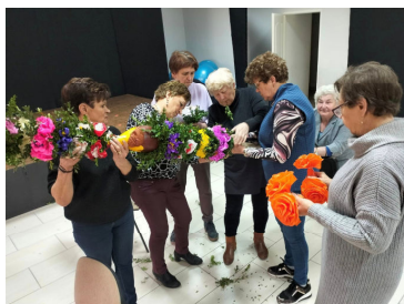
Klub Senior+ otwarty dla wszystkich