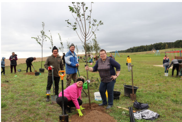
Wspólne sadzenie drzew str. 6