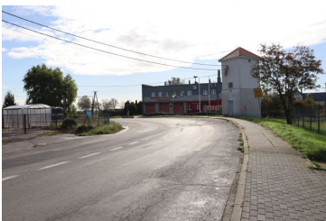
Inwestycje str. 7-10