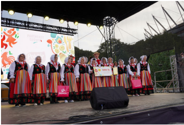
Ogólnopolski sukces „Polnych Maków” str. 2