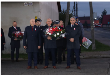
105. rocznica odzyskania niepodległości str. 5