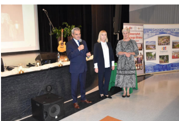
Seniorzy rozpoczęli kolejny rok na UTW str. 17